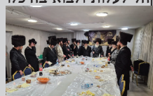
קהל הקודש בהבלדה במוצאי שבת

המשתתפים מסרו את רשמיהם ורגשותיהם מהשהיה המרוממת בלודמיר, מתוך סיפוק רב והתעלות מיוחדת.